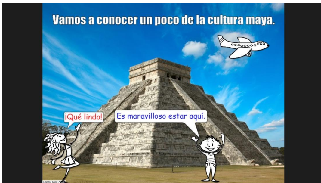
Figura 1: Foto personalizada elaborada no Toony Tool

Dois exemplos de utilização de textos elaborados com este programa são os apresentados nas Figuras 1 e 2 a seguir.