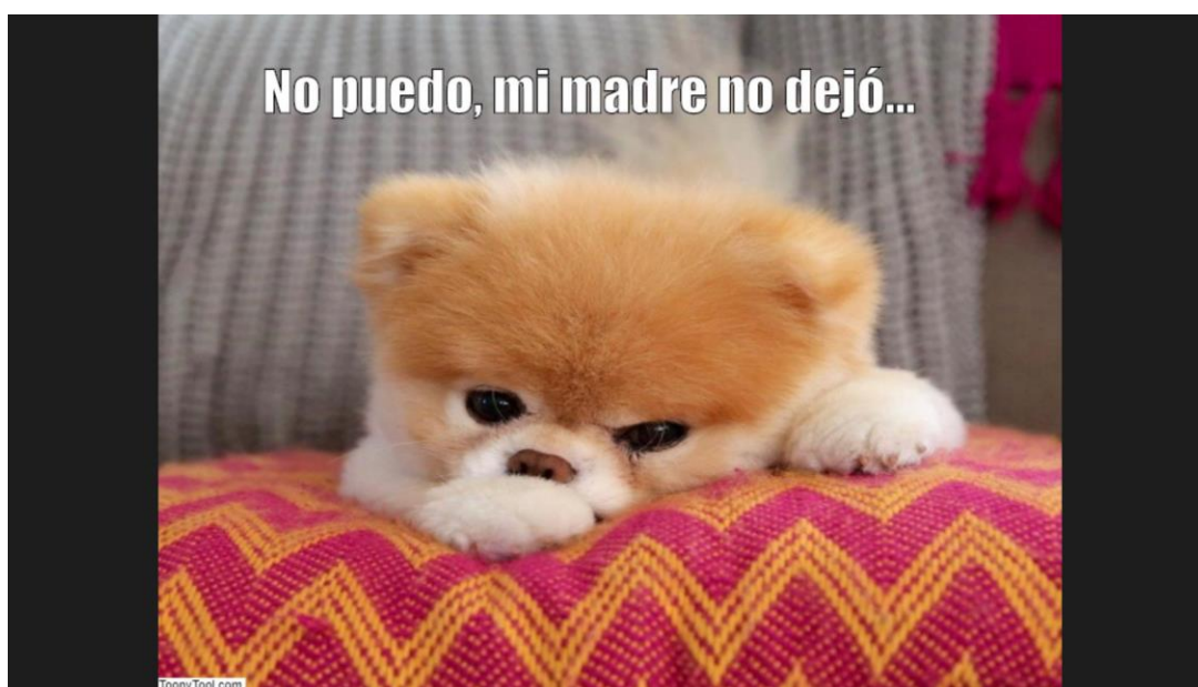
Figura 2: Meme elaborado no Toony Tool