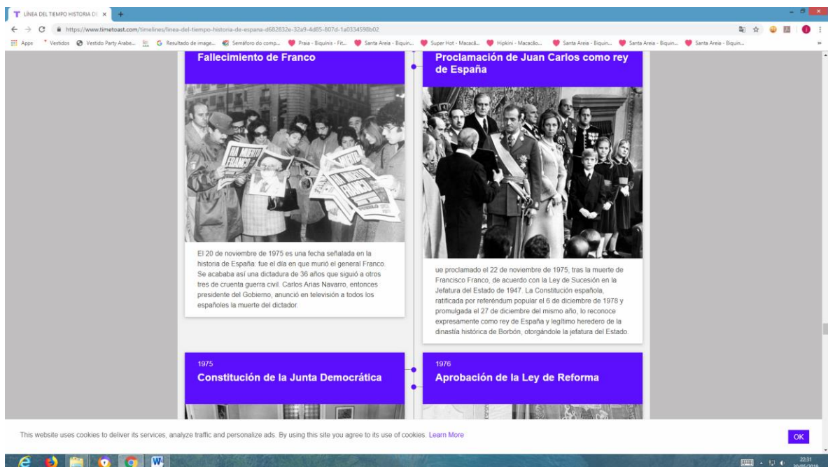
Figura 4: Exemplo de visualização detalhada de uma linha do tempo sobre a história da Espanha